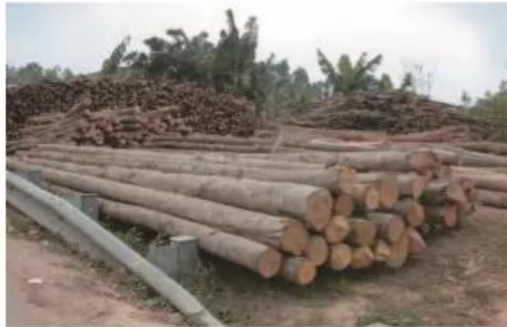
Hình 48.2. Gỗ tròn dùng cho xây dựng

Trong lâm nghiệp, chế biến gỗ vẫn chiếm tỉ trọng lớn trong chế biến lâm sản. Sản phẩm chủ yếu là ván gỗ xẻ, gỗ dán phục vụ cho xây dựng, đồ mộc dân dụng và trang trí nội thất, ngoài ra còn có bột gỗ để sản xuất giấy.