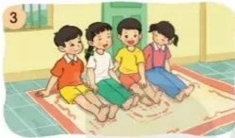
Nu na (...)