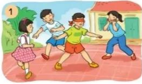
Bịt mắt (...)

2. Dựa vào tranh và gợi ý dưới tranh, nói tên các trò chơi dân gian.