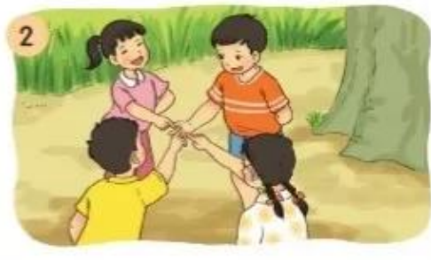
Chi chi (...)