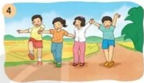
Dung dăng (...)

3. Đặt câu về hoạt động trong mỗi tranh.