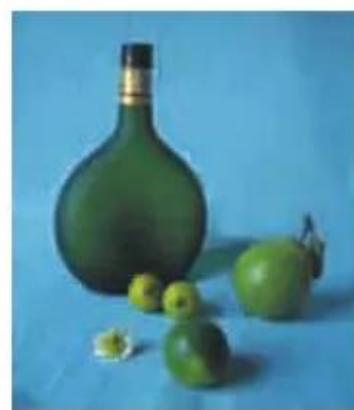
Hình 4. Một số ví dụ về màu nóng, màu lạnh trong thực tế