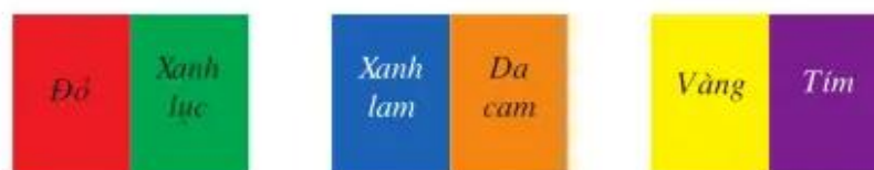
Hình 3. Các cặp màu bổ túc