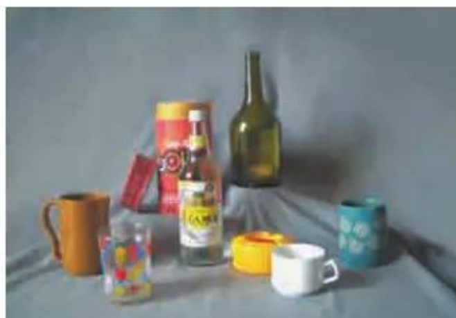
Hình 1. Một số đồ vật dạng hình trụ có thể sử dụng làm mẫu vẽ