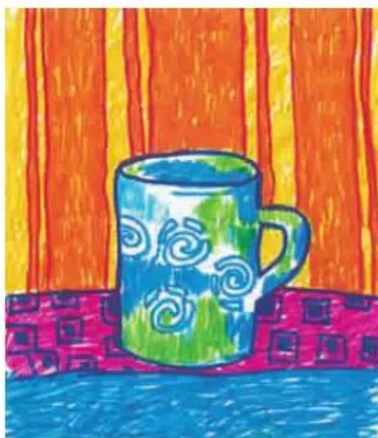
Cái ca. Bài vẽ của học sinh