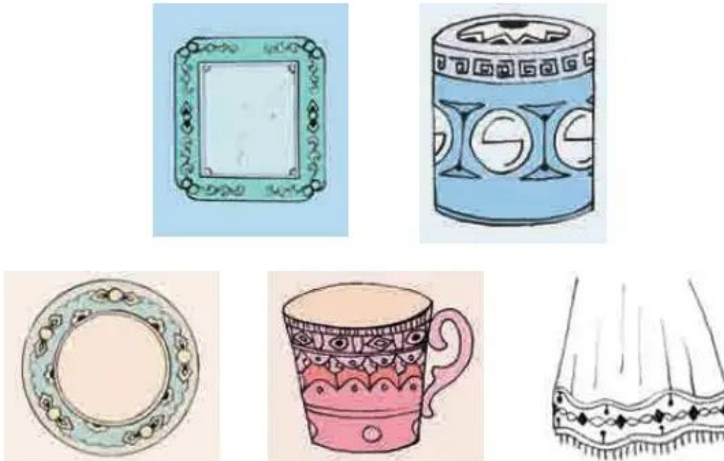
Hình 1. Một số ví dụ về trang trí đường diềm trên các đồ vật