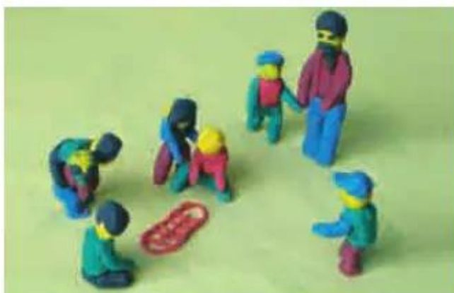
Hình 1. Một số hình nặn các dáng người