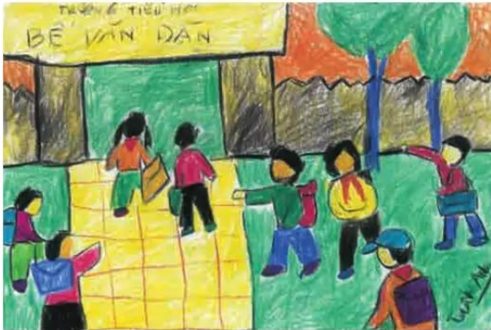
Đến trường. Tranh sáp màu của Tuấn Anh, học sinh tiểu học