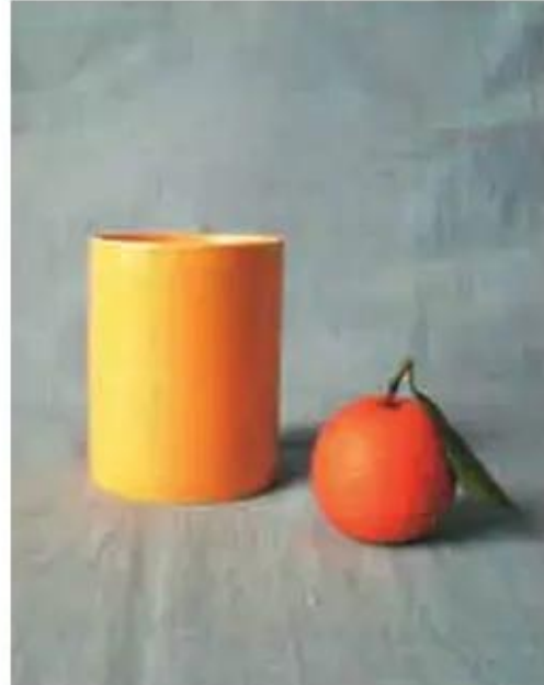
Hình 1. Gợi ý cách đặt mẫu vẽ dạng hình trụ và hình cầu