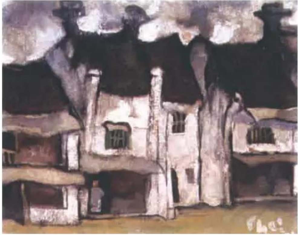
Phố cổ. Tranh sơn dầu của họa sĩ Bùi Xuân Phái