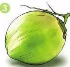
quả đ u