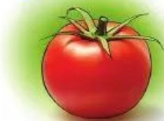
cà ch u