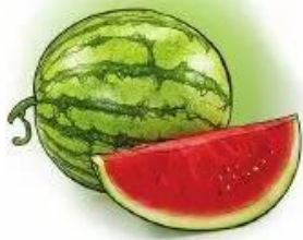
quả đ u