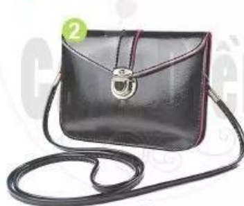
x ă c