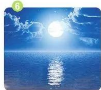
s á ng v ắ ng v ắ c