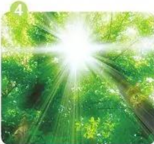
tia n ă ng