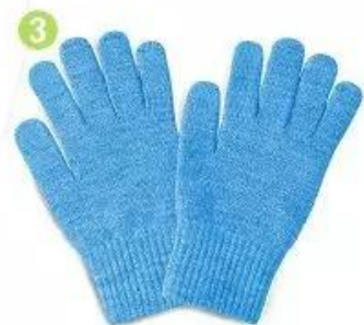
g ă ng