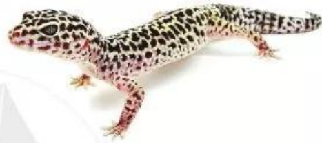
t ă c kè