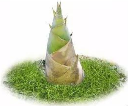
m ă ng