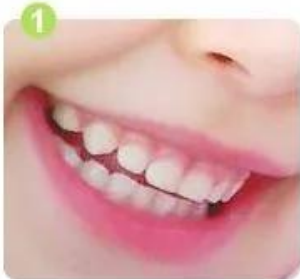
r ă ng