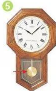
quả l ă c