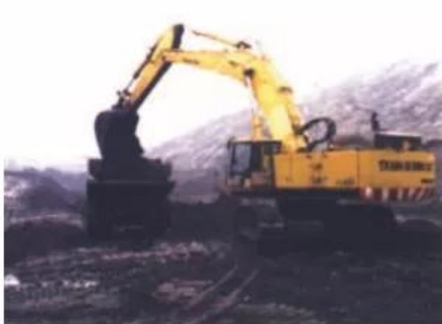
Hình 56 - Khai thác than đá

– Loại tài nguyên khôi phục được như đất trồng, các loài động vật và thực vật. Nếu sử dụng hợp lí, thì độ phì của đất không những được phục hồi mà đất còn có thể màu mỡ hơn. Tài nguyên sinh vật cũng có thể được tái tạo và phát triển.