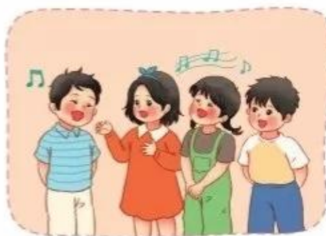
Hát tốp ca