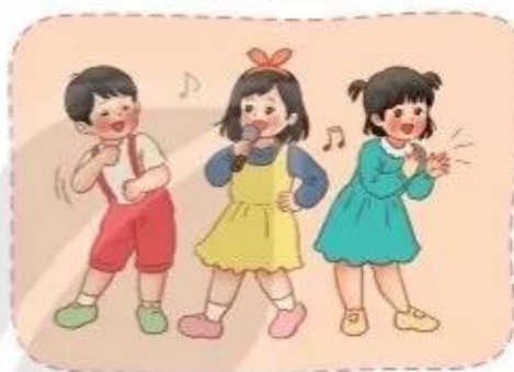
Hát kết hợp vận động