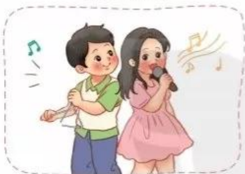
Hát kết hợp gõ đệm