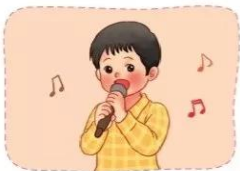
Hát đơn ca