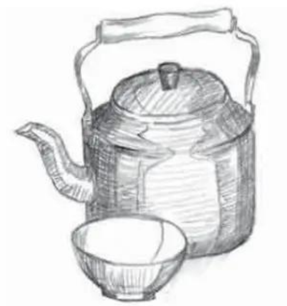
Hình 2. Cách vẽ đậm nhạt