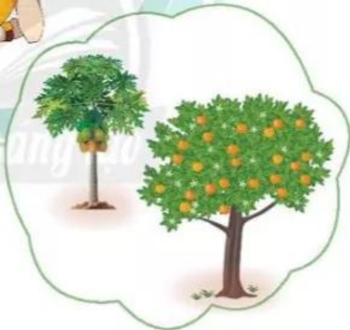
Cây ăn quả