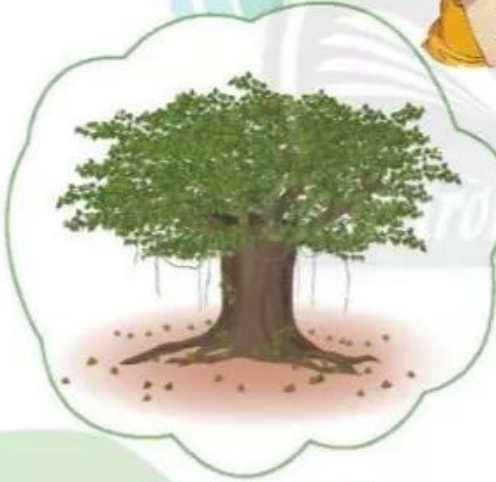
Cây bóng mát