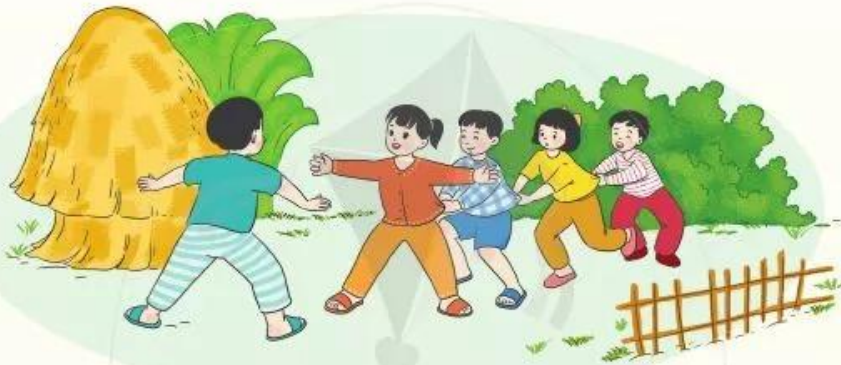
Chơi rồng rắn lên mây