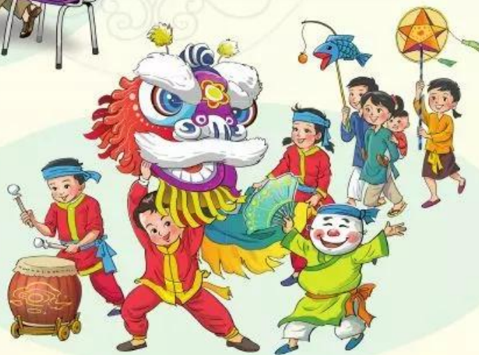
Múa lân (múa sư tử)