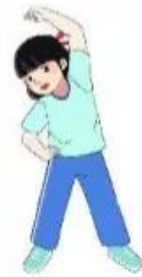
tập thể dục