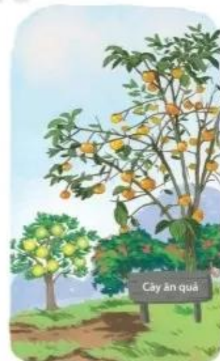
M: cây hồng