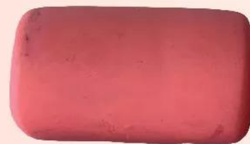
Khối trụ ngắn