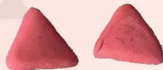
Khối tam giác