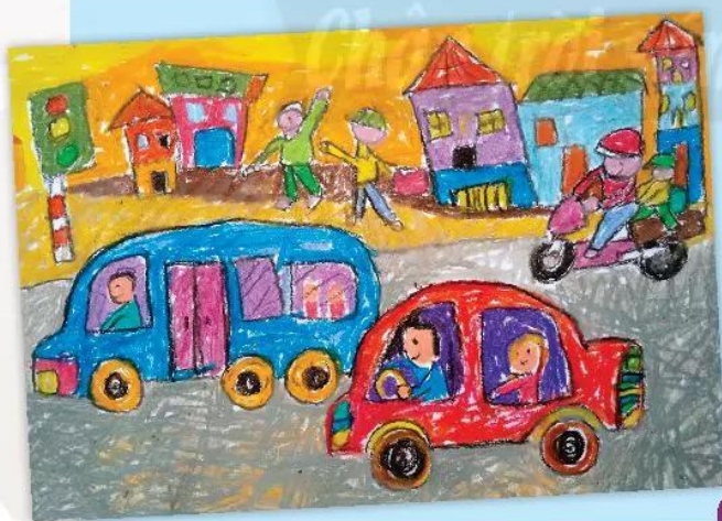
3. Vẽ màu cho bức tranh.