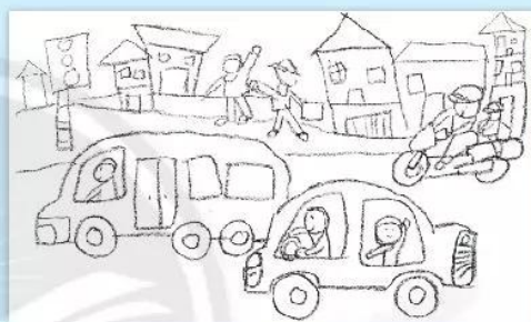
2. Vẽ thêm người và cảnh vật phù hợp.