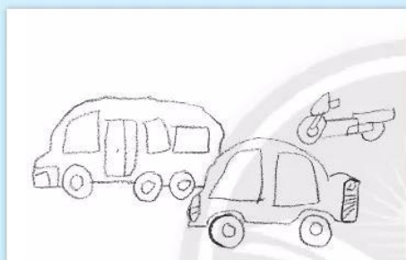
1. Vẽ hình phương tiện giao thông.

Quan sát và chỉ ra cách vẽ tranh về phương tiện giao thông theo gợi ý dưới đây.