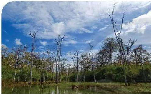
1 Rừng Yok Đôn ở Tây Nguyên.