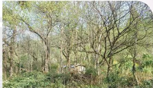
2 Rừng đào ở Sa Pa, Lào Cai.