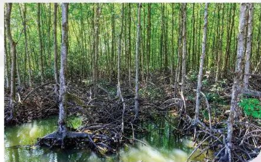
4 Rừng đước ở Cần Giờ, Thành phố Hồ Chí Minh.