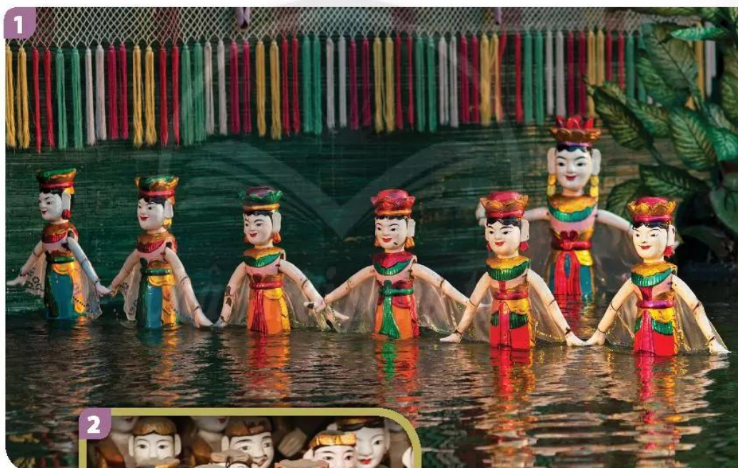
Ảnh 1, 2: Nguồn shutterstock.com