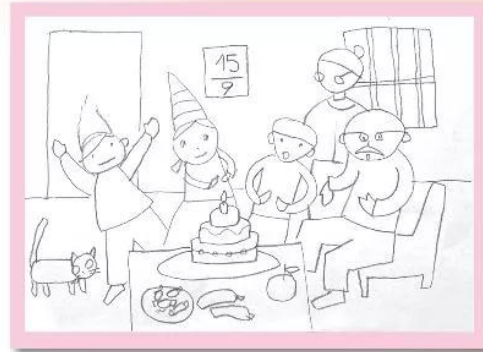
2. Vẽ người thân, bạn bè và đồ vật trong buổi sinh nhật.