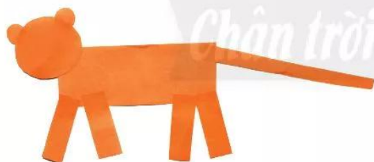
2. Dán các hình để tạo chú hổ.