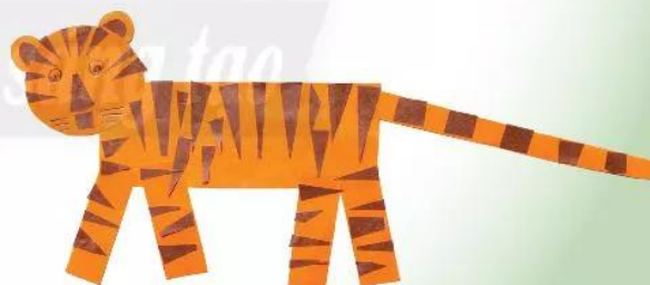
3. Trang trí cho chú hổ thêm sinh động.