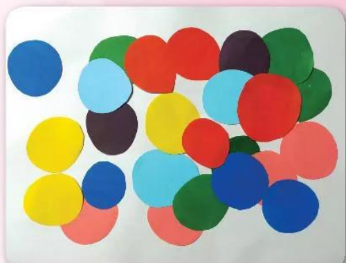
1. Cắt giấy màu theo hình yêu thích.

Quan sát hình và chỉ ra cách tạo sơ đồ tên các bài học theo gợi ý dưới đây.