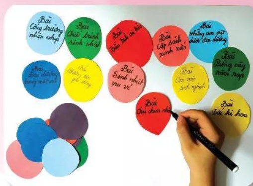
2. Viết tên các bài học vào giấy.