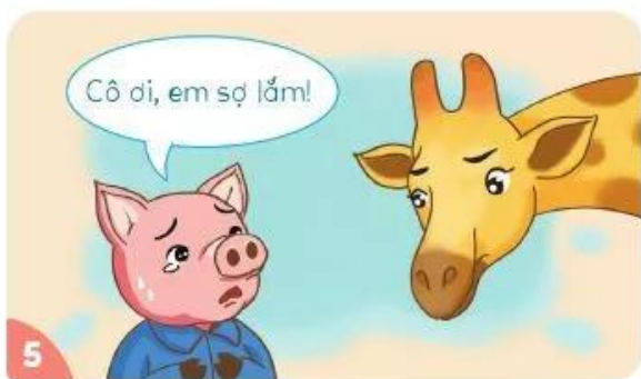
Heo con tìm đến cô giáo và kể lại mọi chuyện.