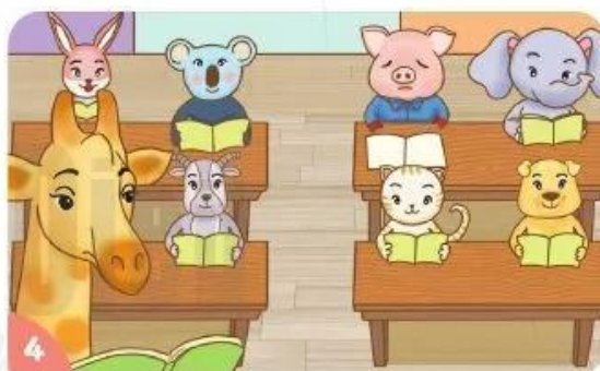
Heo con không thể tập trung học bài.