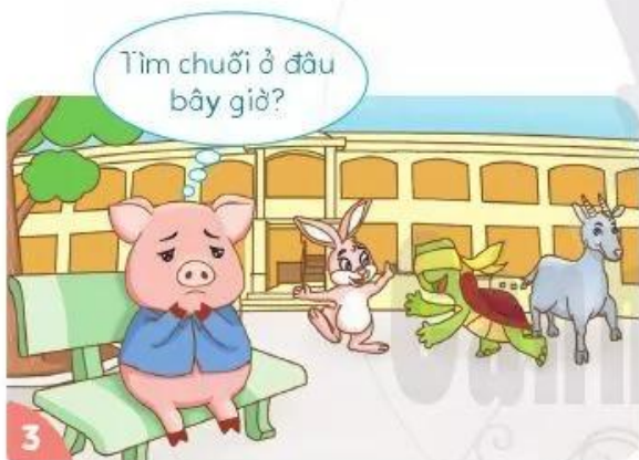
Heo con lo lắng, sợ hãi.