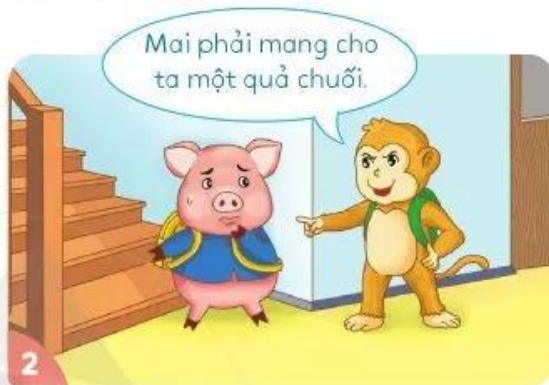
Khỉ thường đón đường và bắt nạt Heo con.