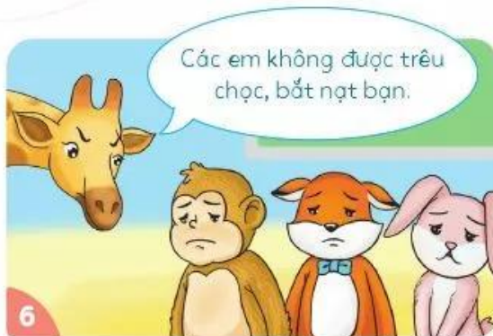
Cô giáo đã nhắc nhở các bạn.