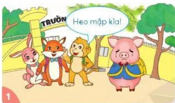
Ở trường, Heo con hay bị các bạn trêu chọc.