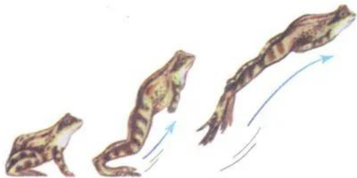
Hình 35.2. Các động tác di chuyển trên cạn khi nhảy