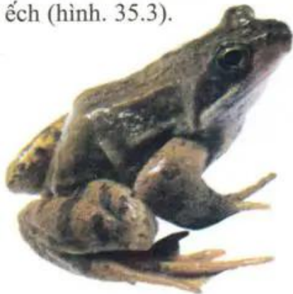
Hình 35.1. Hình dạng ngoài của ếch đồng

– Thả ếch vào nước trong bể kính, hãy quan sát cách di chuyển trong nước của ếch (hình. 35.3).