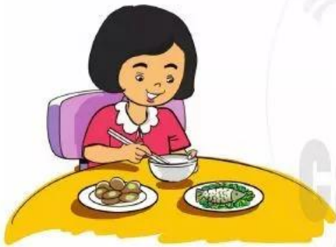
Loan ăn trưa lúc 11 giờ.