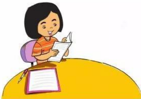
Buổi tối, Loan đọc sách lúc 8 giờ.