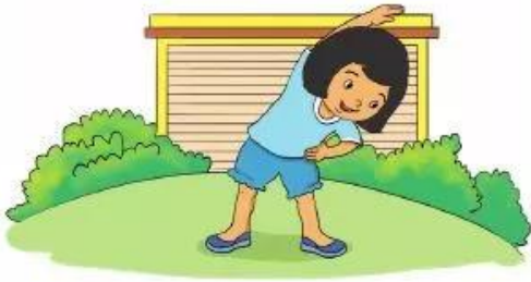
Buổi sáng, Loan tập thể dục lúc 6 giờ.