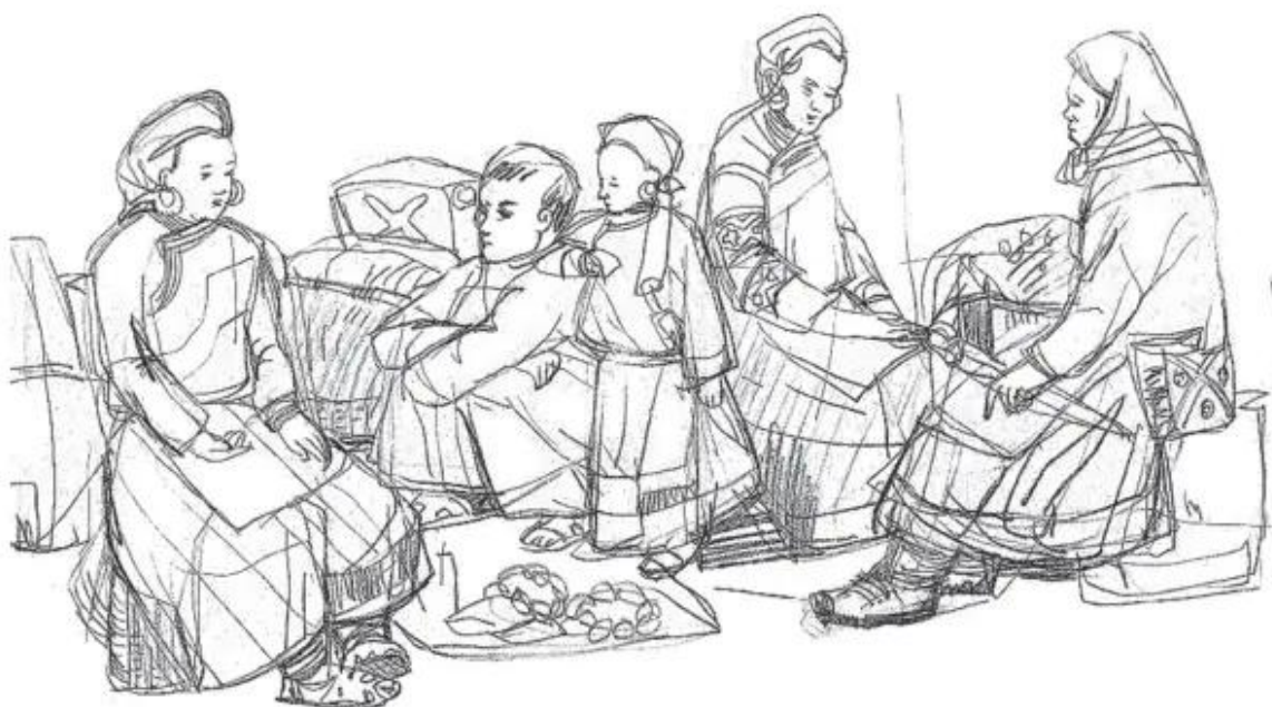
Hình 1. Cảnh một góc chợ (Kí hoạ chì than)