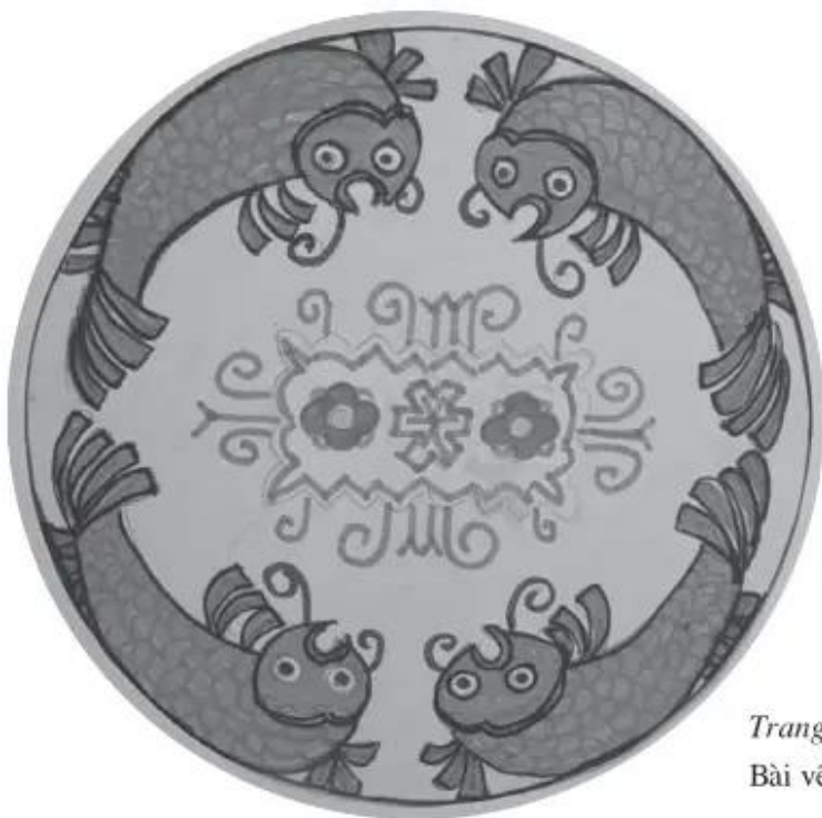
Trang trí đĩa tròn Bài vẽ của học sinh