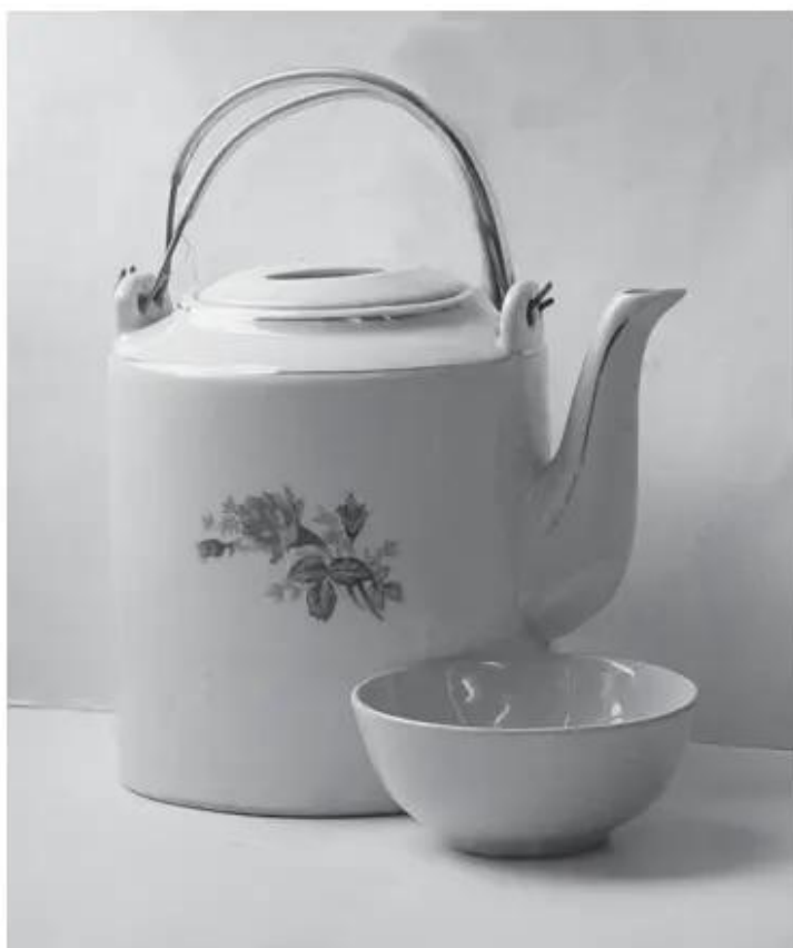
Hình 1 Gợi ý cách bày mẫu cái ấm tích và cái bát