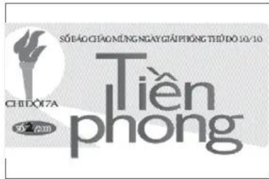
Gợi ý trang trí đầu báo tường. Bài vẽ của học sinh