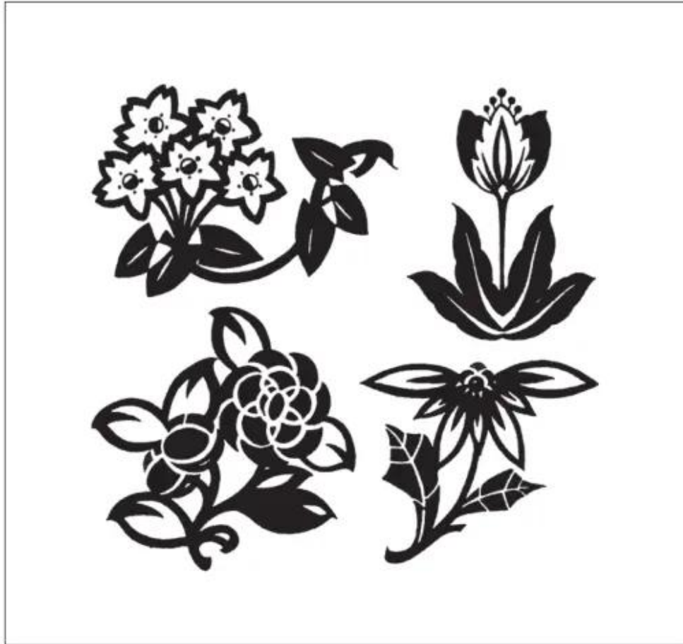
Hình 1. Một số hoạ tiết hoa, lá