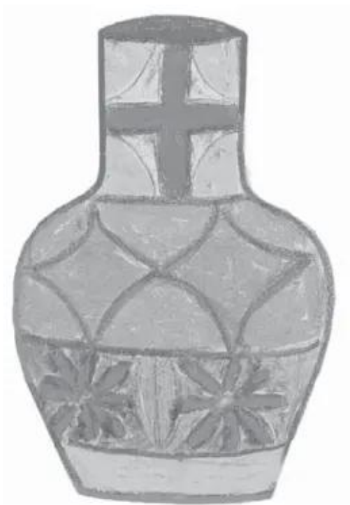
Lọ hoa. Bài vẽ của học sinh