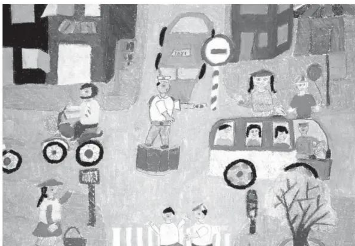
Giao thông. Bài vẽ của học sinh