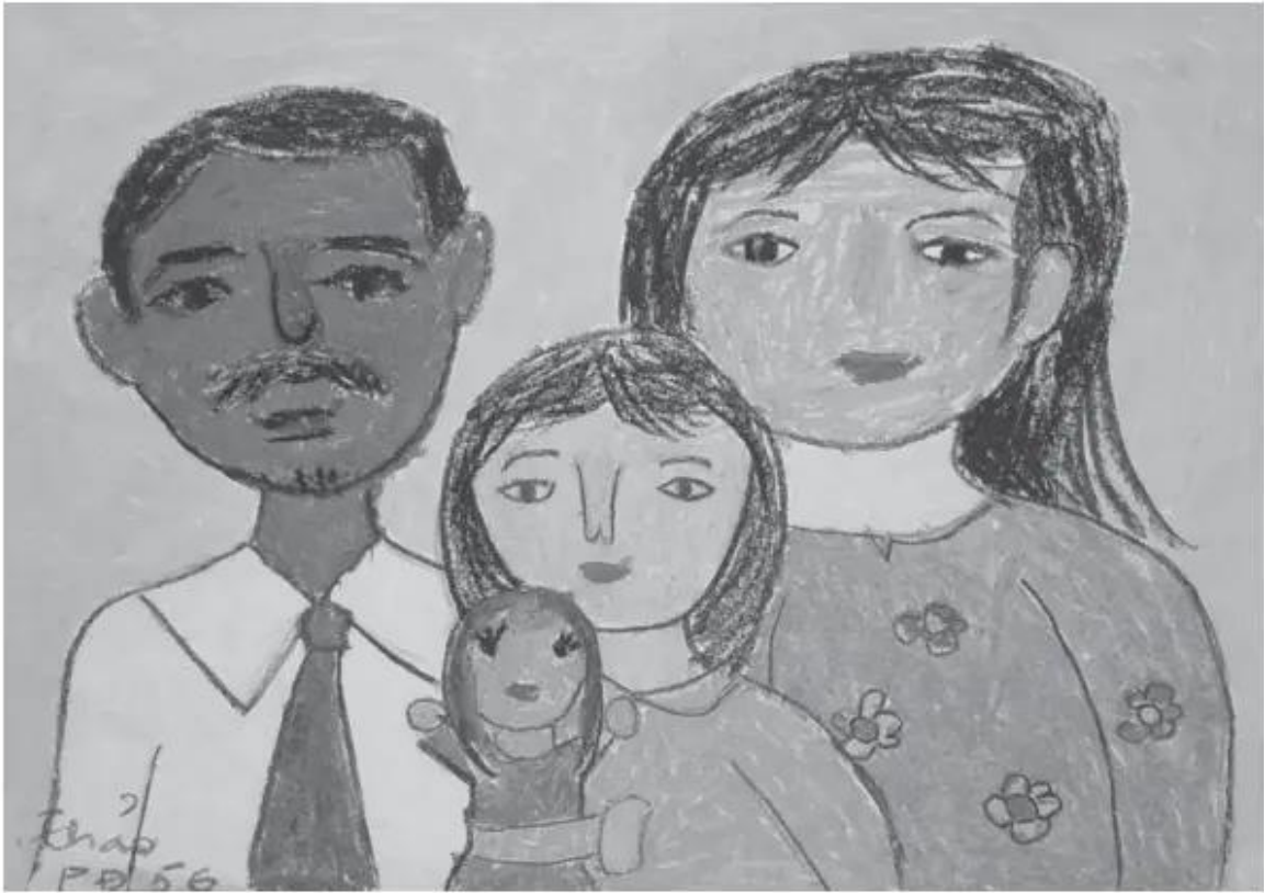
Gia đình em. Bài vẽ của học sinh