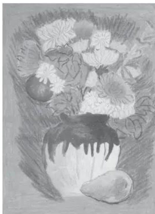
Lọ hoa và quả. Bài vẽ của học sinh