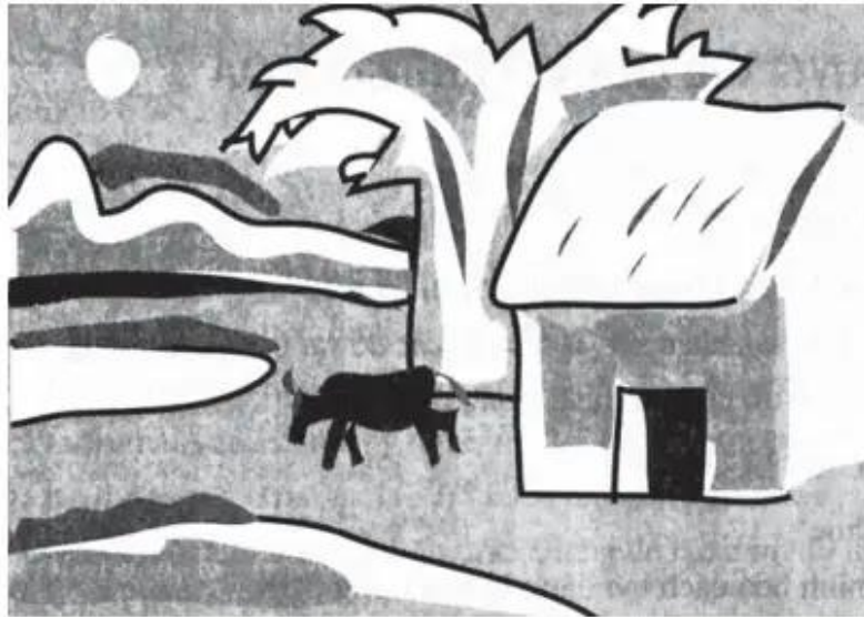
Hình 3. Cảnh đã chọn và thể hiện