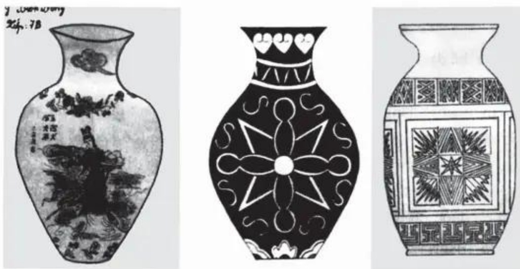
Hình 1. Một số lọ hoa trang trí