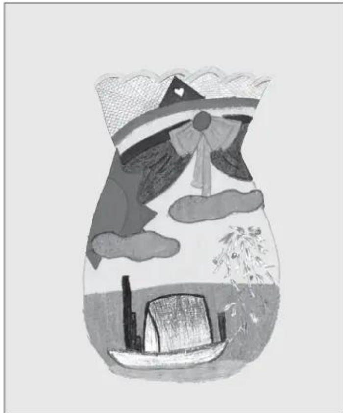
Bài vẽ lọ hoa của học sinh