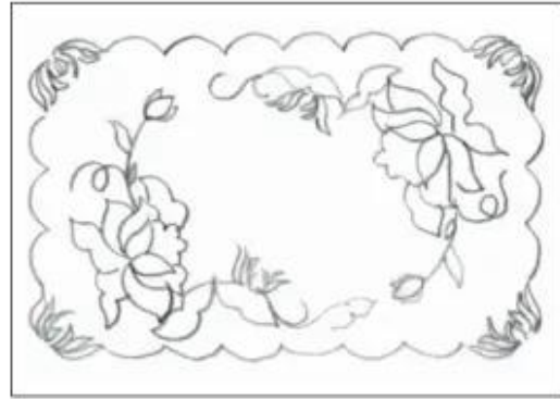
b) Thể hiện