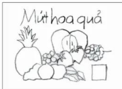
b) Thể hiện