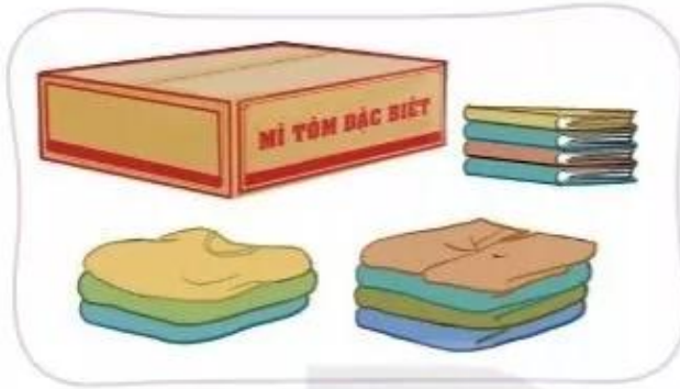
Chuẩn bị quà tặng bạn

Bước 3: Phân công nhiệm vụ, hẹn ngày giờ thực hiện.