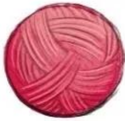
Làm quả bông bằng sợi len