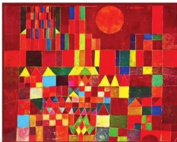
Lâu đài và mặt trời – Tranh sơn dầu của họa sĩ Pôn Cờ-li

Hình cơ bản nào được trang trí lặp lại trong những hình túi xách dưới đây: