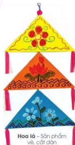
Hoa lá - Sản phẩm vẽ, cắt dán của Hà Phương

Có nhiều cách sắp xếp hình cơ bản lặp lại để trang trí sản phẩm mỹ thuật.