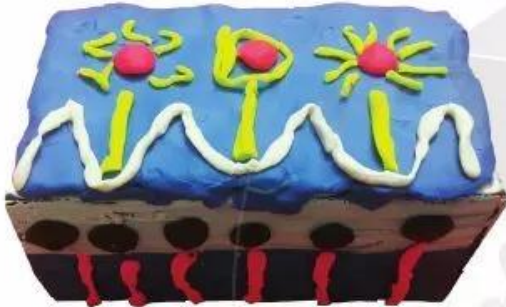
Bánh tặng mẹ - Sản phẩm đất nặn của Thanh Hà

Em có thể sáng tạo chiếc bánh sinh nhật bằng nhiều cách.