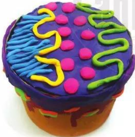
Chiếc bánh của em Sản phẩm đất nặn của Mai Dung