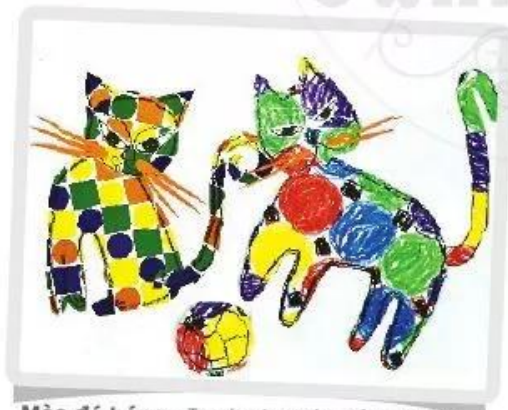
Mèo đá bóng - Tranh sắp màu của Tấn Tài

Em có thể tạo hình con vật nuôi quen thuộc bằng cách nào khác?