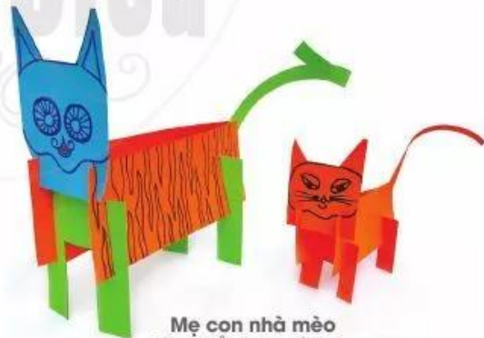
Mẹ con nhà mèo Sản phẩm vẽ, cắt dán của Ngọc Vũ