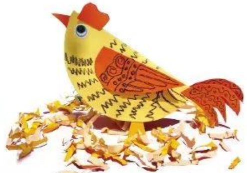
Con gà - Sản phẩm vẽ, cắt dán của Võ Thiên Thanh