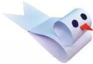
Con chim Sản phẩm cắt dán của Đậu Thu Hà