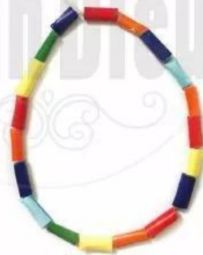
Vòng cổ - Sản phẩm cắt dán của Minh Thư