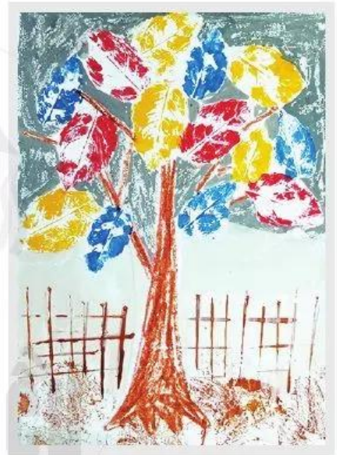
Cây và hàng rào Tranh in của Trần Thanh Dung