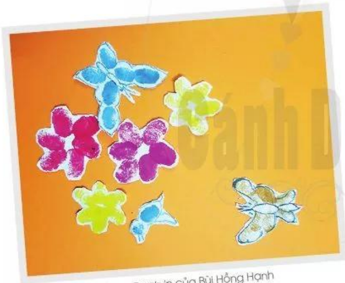
Hoa - Tranh in của Bùi Hồng Hạnh