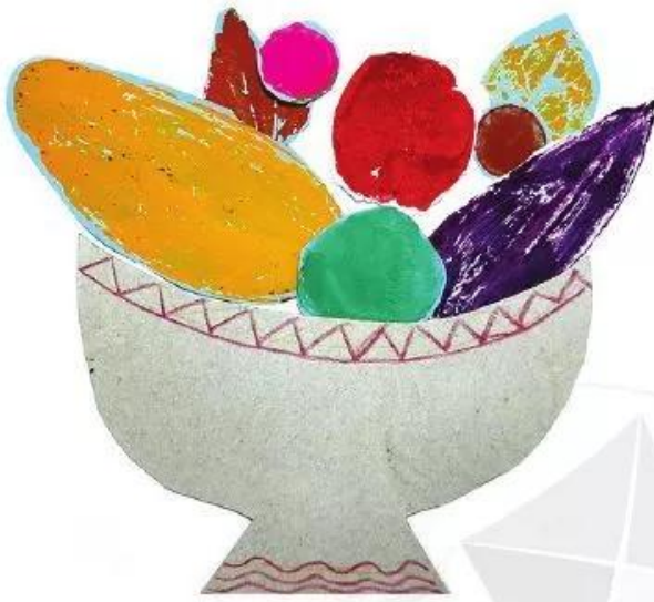
Ngũ quả - Tranh in và cắt dán của Nguyễn Quỳnh Hoa