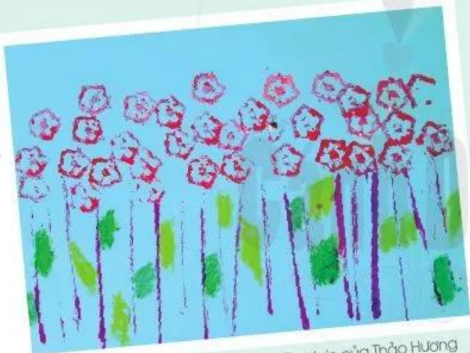
Hoa trong vườn – Tranh in của Thảo Hương