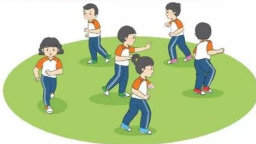
Trò chơi "Ai sẽ bị bắt?"