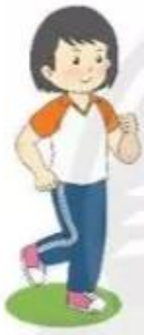
Chạy tại chỗ