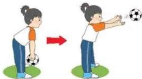
2. Tung bóng lăn trên mặt đất