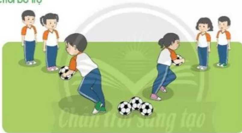
Trò chơi "Đưa bóng về tổ"