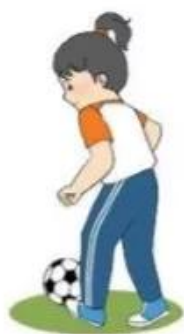
1. Luyện tập cá nhân