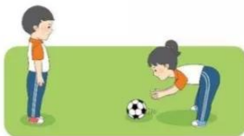
2. Luyện tập cặp đôi