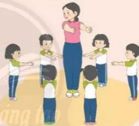
Trò chơi "Theo lệnh chỉ huy"