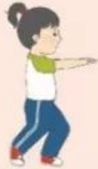
1. Luyện tập cá nhân