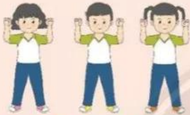
3. Luyện tập theo nhóm