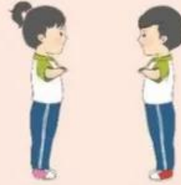
2. Luyện tập cặp đôi