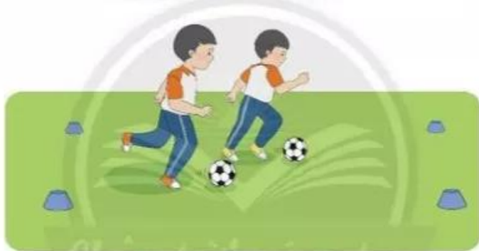
2. Luyện tập cặp đôi