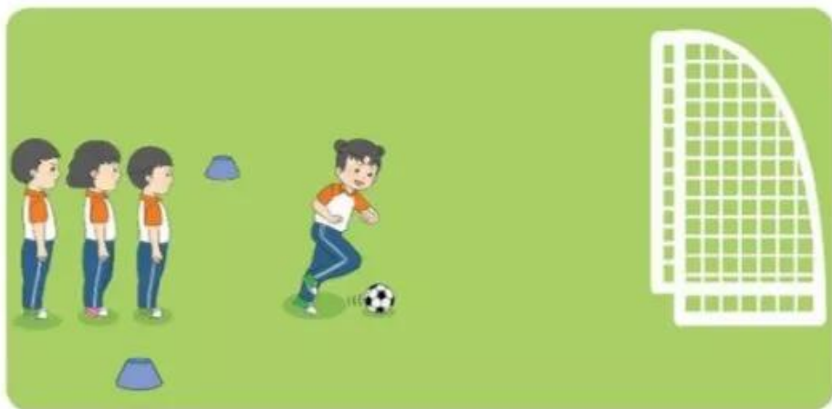
3. Luyện tập theo nhóm