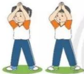
Đứng vỗ tay tại chỗ