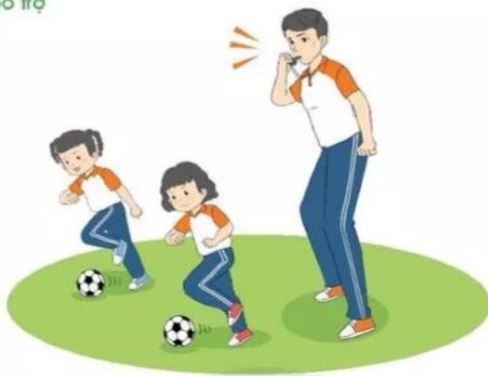
Trò chơi "Ai dẫn bóng nhanh hơn?"