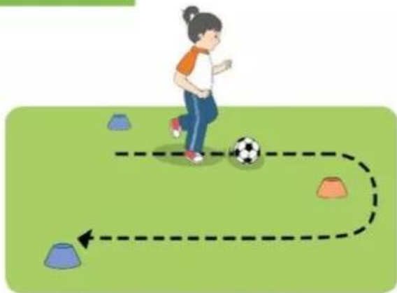
1. Luyện tập cá nhân