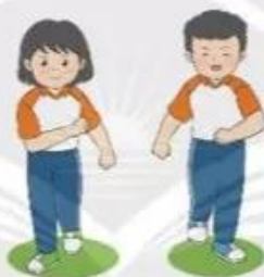
Chạy nhẹ nhàng