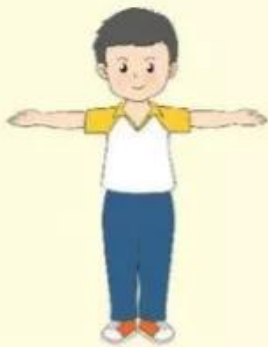
1. Luyện tập cá nhân