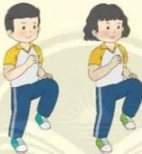
Chạy nâng cao đùi tại chỗ