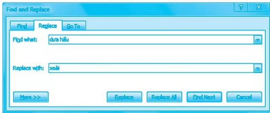
Hình 14. Hộp thoại “Find and Replace”

13.4. Quan sát các lệnh sau có trong hộp thoại “Find and Replace” (Hình 14).