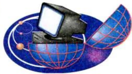
Hình 6. Liên lạc với bạn bè

Hình bên là chiếc máy tính chuyên dùng để đọc sách. Hiện nay tại nhiều nước, học sinh có thể đọc sách có trong thư viện bằng máy này.