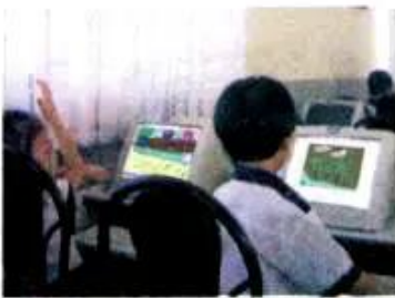
Hình 4. Học vẽ