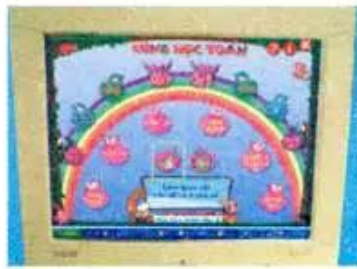
Hình 5. Học làm toán