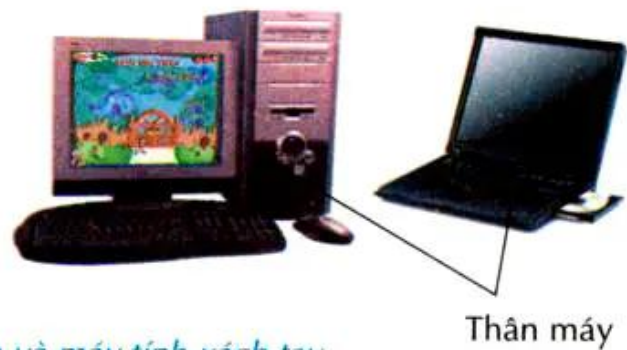
Hình 2. Máy tính để bàn và máy tính xách tay

• Màn hình của máy tính trông giống như màn hình ti vi. Các dòng chữ, số và hình ảnh hiện trên màn hình cho thấy kết quả hoạt động của máy tính.