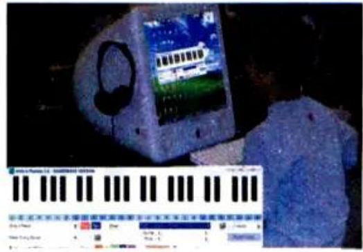
Hình 3. Học nhạc